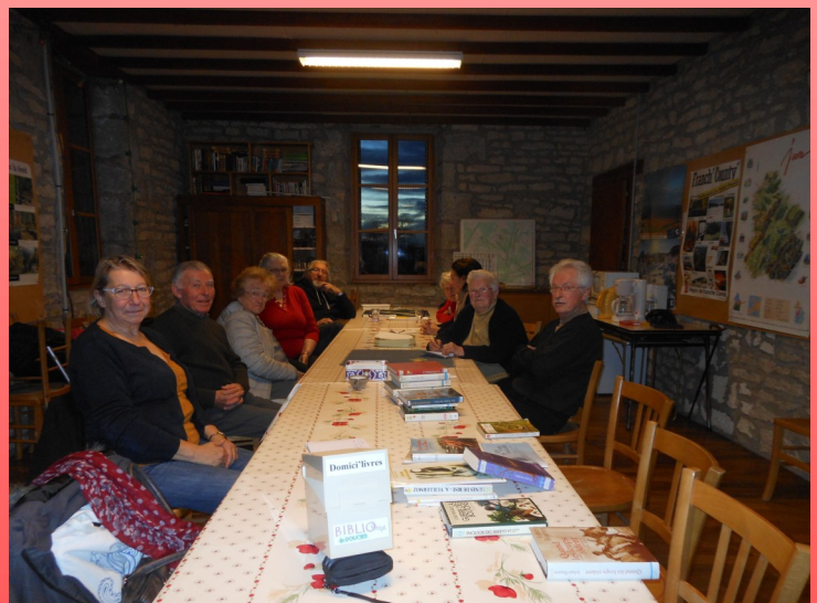
Domici'livres à Songeson