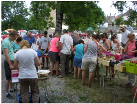
Présentation Domici'livres à Chatillon