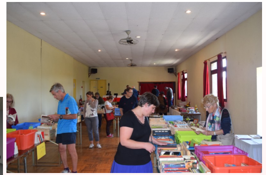
La foire aux livres de septembre